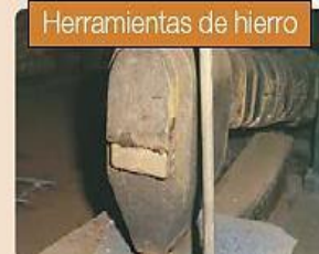
Herramientas de hierro

Geniliza SAF. Servicio Aerofotogramétrico de la FACH