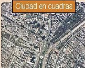
Ciudad en cuadras